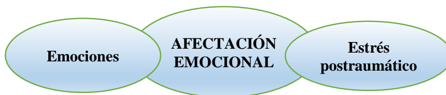
Figura 4: Familia de Códigos: Afectación emocional

Al ser los adolescentes víctimas del reclutamiento forzado se presenta una desintegración familiar que facilita el daño interna mental y funcional del grupo, por lo que se resalta en los resultados de la presente investigación que a pesar del daño la familia mantenga la unidad y se encuentre dispuesta para continuar siendo esa factor de afecto de afecto y protección de gran ayuda en ese proceso de aceptación, reconciliación y reparación que afrontan los jóvenes en su proceso de recuperación, comentarios como “mi familia me da mucho amor y cariño” (P9), o “mi mamá siempre ha sido muy buena conmigo” (P10), son un bálsamo de alivio necesario y fundamental de recuperación dentro de todo lo negativo de la experiencia vivida.