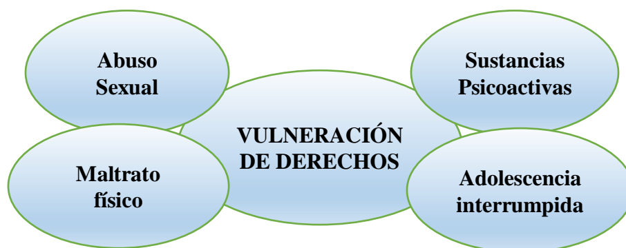
Figura 2:Familia de Códigos: Vulneración de derechos

Así las cosas se sobreentiende que el reclutamiento forzado a generado condiciones de vulneración relacionados con crímenes en contra de personas internas o ajenas al conflicto armado como los es el homicidio mediante actos degradantes e inhumanos “ver morir a una señora que no quería caminar más hacía adentro del monte porque no podía quedarse de pie, ella le escupió la cara a un comandante y él sacó un arma y le disparó sin decirle nada” (P9), por lo anterior se considera relevante abordar oportunidades de vida evitando la promoción del conflicto al tomar como referente las experiencias del reclutamiento por parte de los involucrados buscando de esta manera acciones de no repetición en futuras generaciones, con acciones de daño como “Tener que matar un señor porque no le quiso dar plata al comandante y como yo estaba aprendiendo a manejar el arma me pusieron a mí a dispararle” (P12), haciendo evidente que la violencia mediante el uso de armas arrebatando la vida de otros se manifiesta e incrementa de múltiples formas a lo largo del conflicto armado, a través del código obtenido en esta situación de riesgo muerte y armas.