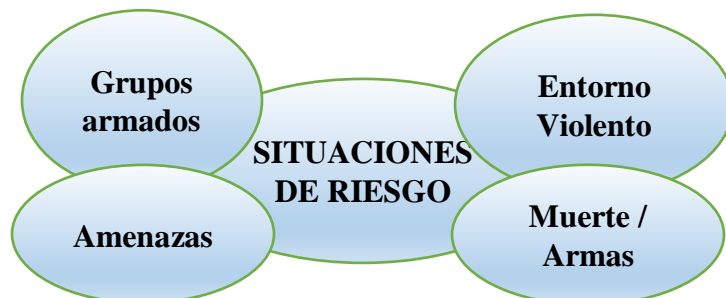
Figura 1: Familia de códigos: situaciones de riesgo