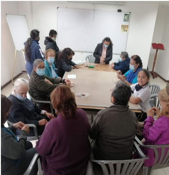
Anexo 5.4 salón de catequesis. Parroquia la Resurrección.