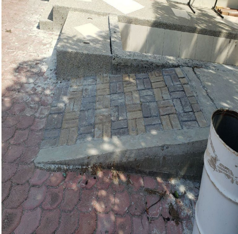
Anexo 5.3 Acceso a la Parroquia, San Ramón Neonato.