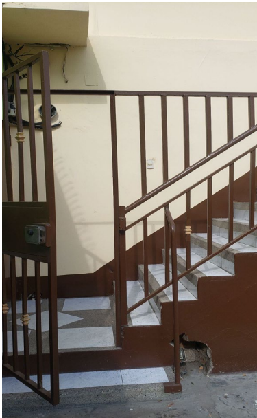
Anexo 5.2. Acceso a los salones de formación.