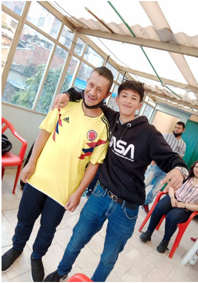
Anexo 5.1 ejercicio práctico