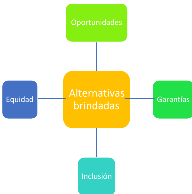
Ilustración 3. Familia de Códigos " Alternativas Brindadas"

estudiantes migrantes provenientes de Venezuela, y por otra parte, a la percepción de inclusión y de equidad que tienen los entrevistados sobre los procesos de matrícula en la IE.