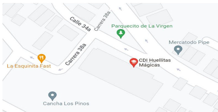
Imagen 1. Ubicación geoespacial del Centro de Desarrollo Infantil

habitantes zonas rurales e inmigrantes que viven en condiciones precarias, carentes de servicios públicos y sanitarios y en zonas de alto riesgo por la contaminación del agua y el aire que genera la refinería de Ecopetrol ubicada en esta zona.