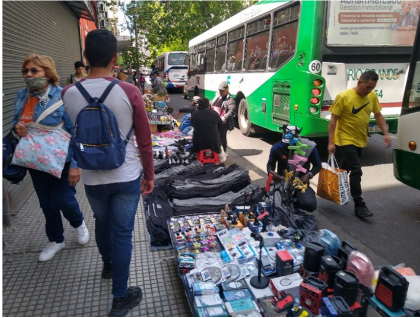
Fotografía tomada en Av. Rivadavia, reconocimiento de campo para recolección de información sector Once, Buenos Aires, Argentina. Octubre de 2022.