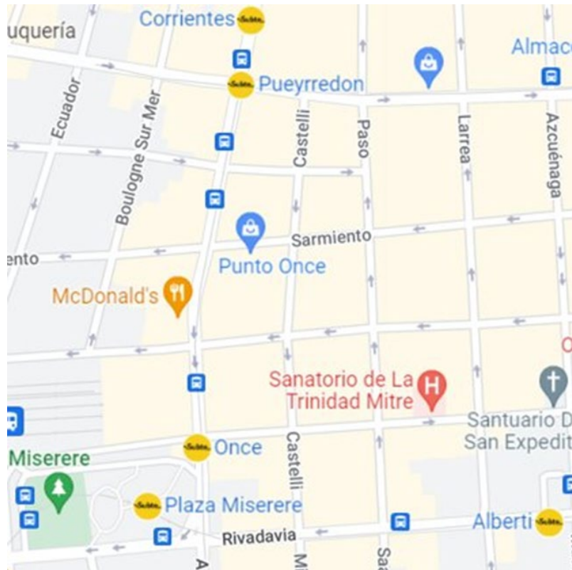
Cartografía del sector Once, Ciudad Autónoma de Buenos Aires, Argentina. Tomado de: Google Maps.

En este sector hay un alto porcentaje de migrantes senegaleses, quienes se ubican principalmente sobre las avenidas Sarmiento, Castelli, Paso y Larrea, entre las avenidas Pueyrredón y Bartolomé Mitre, su actividad comercial está relacionada principalmente con ropas, textiles y artículos deportivos; las mujeres y los hombres locales se ubican principalmente en la avenida Sarmiento, la avenida Paso y la Avenida Castelli y se dedican principalmente a la venta de comida y artículos para el hogar (mujeres), mientras que los varones locales se dedican a la venta de artículos deportivos principalmente.