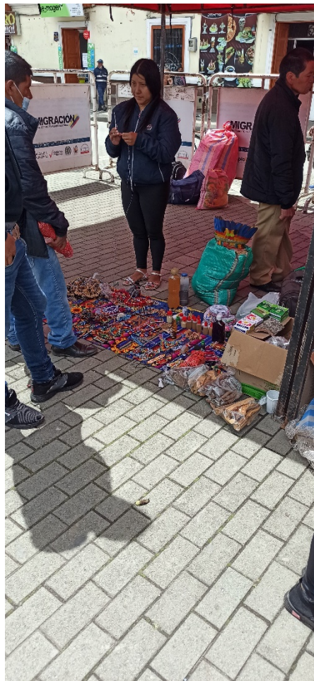
Venta informal en la ciudad de San Juan de Pasto - Nariño, Colombia.

Se identificó que la causa más común que lleva a las personas a dedicarse a la economía informal es la falta de oportunidades dentro de la formalidad, y las situaciones difíciles en sus países o ciudades de procedencia. En cuanto a la observación participante en la ciudad de Cúcuta, zona fronteriza entre Colombia y Venezuela, ubicada al norte del territorio, la cual se caracteriza por una alta presencia de migrantes, así mismo, los investigadores se desplazaron a San Juan de Pasto e Ipiales, cruzando la frontera hacia la ciudad de Tulcán en Ecuador, en donde a partir de la observación participante y la aplicación de las encuestas, se encontró que en estos territorios la percepción de calidad de vida es estar bien, estar con la familia y tener buenos ingresos.