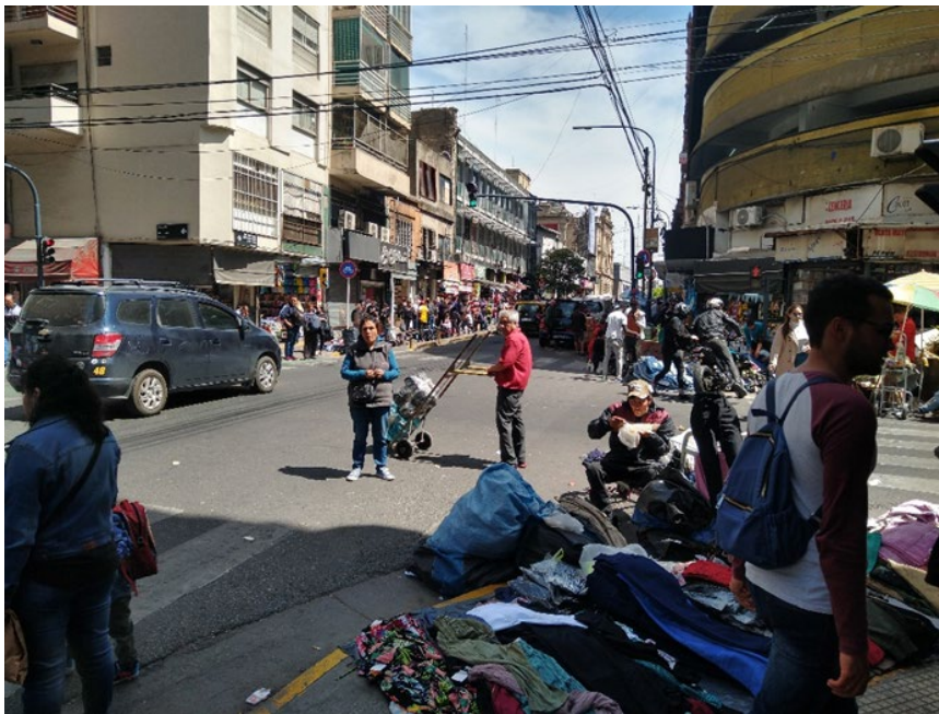
Fotografía del sector Once, uno de los territorios de recolección de información, Buenos Aires, Argentina. Octubre de 2022.

Otro de los sectores visitados fue Flores, entre avenida Rivadavia y Nazca, y Avellaneda y Concordia; Flores es un sitio de alta comercialización tanto formal como informal, dentro de las particularidades que pudimos notar en el territorio es que las personas migrantes venden principalmente ropa, los hombres locales ropa y artículos deportivos, las mujeres ropa y alimentos y ellas se encuentran principalmente junto a los ferrocarriles por donde pasan