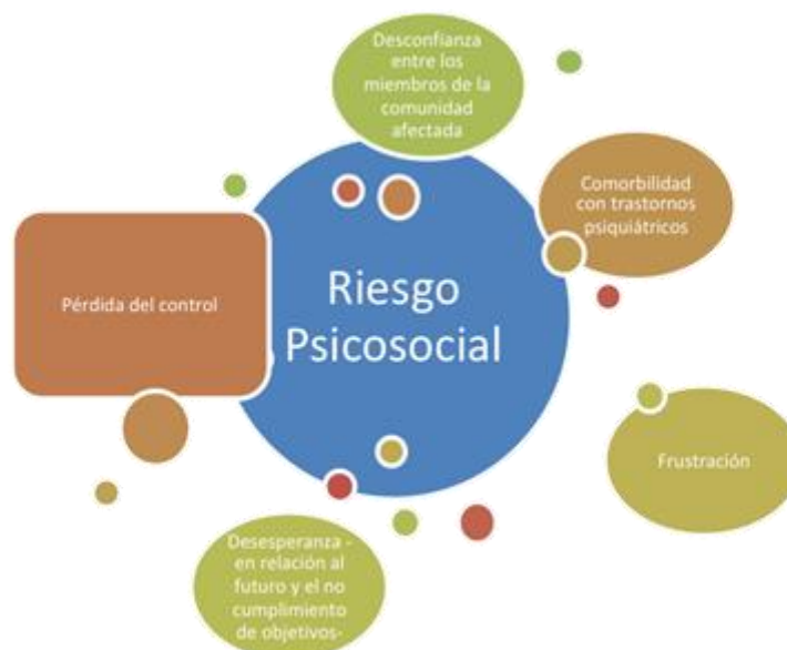
Figura 4. Riesgo Psicosocial.

Nota: Elaboración propia con base en Rodríguez, De la torre y Miranda (2002)