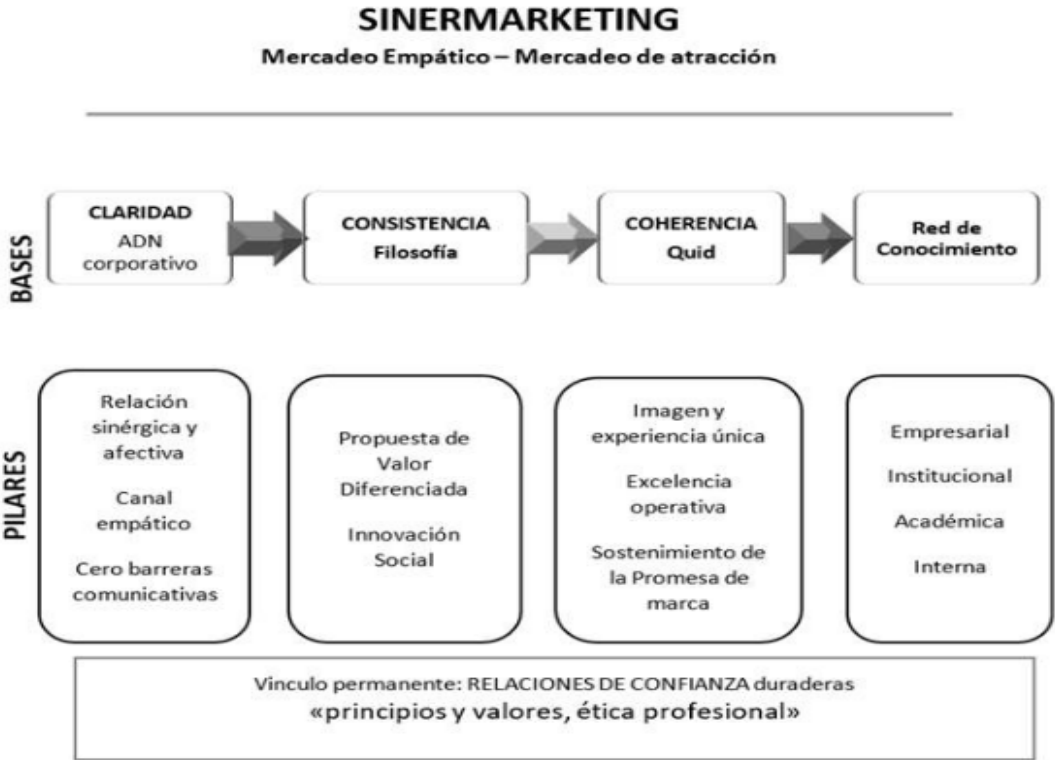
Modelo de apoyo de emprendimiento

Nota. Adaptado de “Propuesta de un modelo de apoyo al emprendimiento que genera sinergia con la innovación social” (p.3), por H, Grisales, 2020, Scielo.