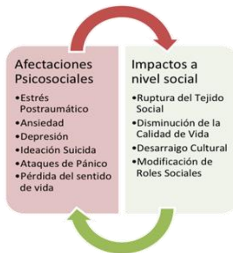
Figura 5. Afectaciones Psicosociales e impactos a nivel social

Como consecuencia de lo anterior, existe una relación dinámica entre afectaciones psicosociales (individuales y colectivas) y los impactos a nivel social. La siguiente gráfica ilustra estos aspectos: