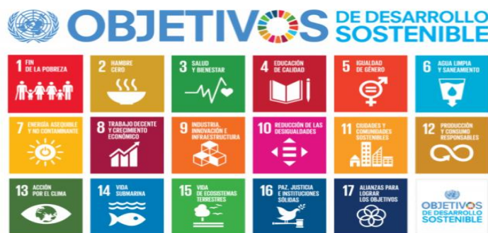
Figura 3. Objetivos de desarrollo sostenible

Nota: Elaboración propia a partir de los ODS del PNUD, 2019.